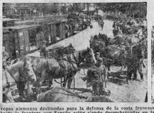
Tropas alemanas destinadas para la defensa de la costa francesa hasta la frontera con España están siendo desembarcadas en la estación de Bayonne

El Poder Ejecutivo ha procedido ya al nombramiento de las primeras autoridades en el nuevo Cantón de Puntarenas. Los límites del nuevo Cantón no están aún definidos; algunos lugares que forman distritos antes no eran sino barrios o caseríos del Cantón 3º. De manera que el Registro Civil no podría decir de un día para otro cuál