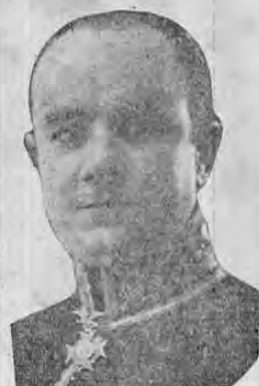
Hon. Don JOAQUIN LARRAIN, Encargado de Negocios de Chile ante nuestro Gobierno, a quien presentamos nuestros respetos.

El mar y la montaña parecen darse la mano e ir paralelos milímetros de kilómetros dejando en medio la franja—cinta que a veces fulge luminosa como la plata puesta al forjado sol; en otras se opaca como la sombra que se apodera de los bosques por la tarde, o se torna suavemente paziza como los trigales en espiga — fuego, riqueza y desolación que señaló el poeta. Tal la tierra del austro: esa es Chile, crisol de una nueva raza americana, donde todos los materiales étnicos y la gama desigual de las ideologías, van plasmando un pueblo nuevo para la América nueva.