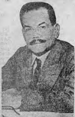
Sr. Don PEDRO AGUIRRE CERDA, Presidente de la República de Chile.