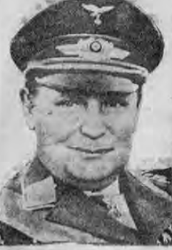
MARISCAL GOERING, de quien se informa ha volado sobre Inglaterra en estos días.

En espera de los golpes decisivos. — Algo de nuestra suerte futura y de la de nuestros hijos se está jugando en la guerra de hoy. — Los pobres seres de la tierra. — Glosando una fantasma de André Maurois. — En busca de la felicidad. — Pero un día llegará, pues lo preven así desde Sirio... y desde la Tierra