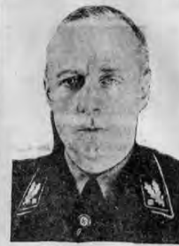
VON RIBBENTROP, el autor del encuentro de Brest Litovsk, en 1939, hoy hace un año.

rió un príncipe Hohenzollern, hiriéndose; un joven que de no haber sido la guerra del 14, o de haber sido con victoria alemana, en estas horas se estaría preparando para ser kaiser, cabeza de un enorme imperio. Hoy hace un año, en Brest Litovsk, en la Polonia invadida por los rusos, se encontraron de nuevo los representantes de Alemania y de Rusia. En el mismo lugar en que se habían encontrado hace un cuarto de siglo; entonces capitularon los rusos a los alemanes. Hace un año, los dos vencidos de la última gran guerra mundial se encontraron en el mismo sitio para decidir el reparto de Polonia.